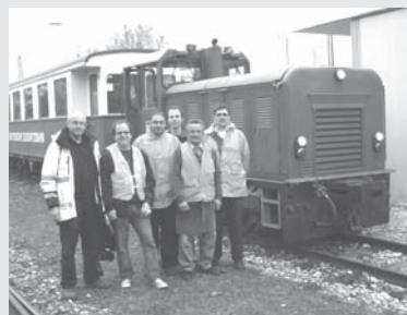
Die Prüfungskommission und ein Teil der Prüflinge vor unserer Diesellok „D8“

Nach umfangreicher Theorie- und Praxisausbildung konnten der Prüfungskommission der UEF Eisenbahnverkehrs-gesellschaft mbH vier Kandidaten für den Diesellokführer und ein Zugführer zur Prüfung vorgestellt werden. Mit den neuen Personalen können Dienste flexibler verteilt werden. Allzeit gute Fahrt!