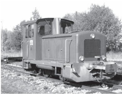
Die „Neue“ im herbstlichen Sonnenlicht des Bahnhofes Amstetten: Ungewohnt erscheint die Kombination aus automatischer GF-Kupplung und herabgeklapptem Mittelpuffer.