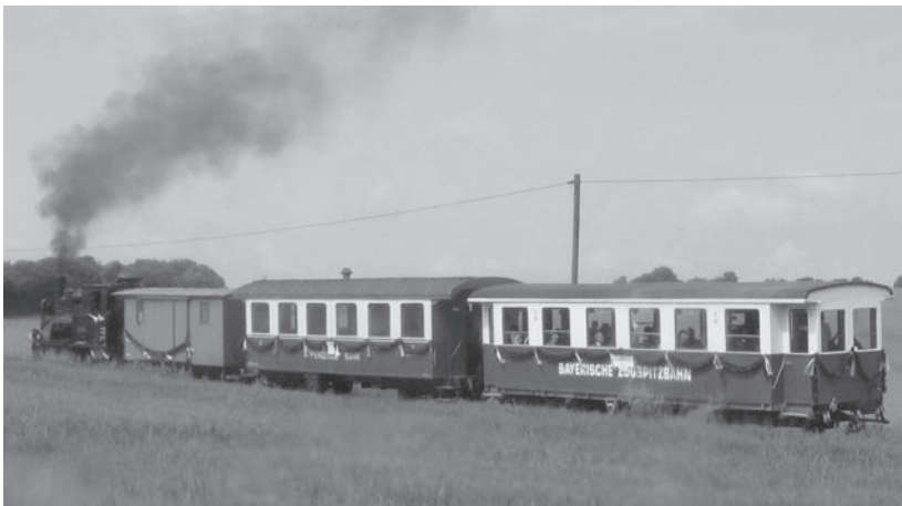
Seinen ersten „großen Auftritt“ hatte der B 19 am 4. Juli als Hochzeitswagen - hier mit dem Zug beim Streckenkilometer 5,2 kurz vor der Ankunft in Oppingen.

Unter der Betriebsnummer „D6“ soll die O&K-Lokomotive nach einer Hauptuntersuchung unter anderem zum Streckenunterhalt eingesetzt werden.