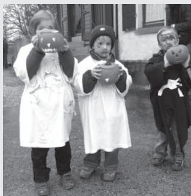
„Geister“ mit handfesten Schnitzergebnissen

Wieder einmal gaben sich Ende Oktober Zauberlehrlinge, Gespenster und andere Geister im gruselig dekorierten Bahnhof Oppingen ein Stelldichein. Mit dem „Halloween-Zug“ auf dem Alb-Bähnle angereist, übten sie sich im Schnitzen von Fensterlichtern oder stärkten sich mit einer leckern Kürbissuppe.