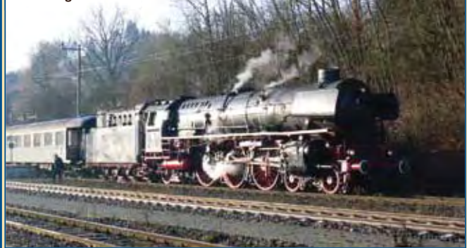
Schnellzuglok 01 1066