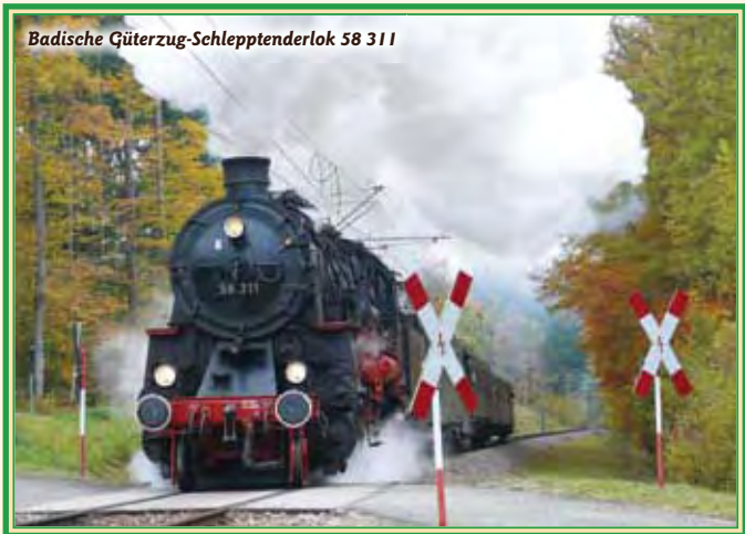
Badische Güterzug-Schleptenderlok 58 311

Ulmer Eisenbahnfreunde e.V. • Sektion Ettlingen Bahnhofstraße 6 • 76275 Ettlingen Telefon: 07 21 – 88 33 61 • Fax: 07 21 – 1 51 58 68 97 Email: albtal@uef-dampf.de