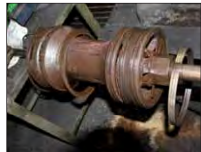
Ausgebauter Schieber der 75 1118

Der rechte Schieberkreuzkopf war stark eingelaufen, sodass dieser unterlegt werden musste. Durch die Abnutzung am Schieberkreuzkopf hat sich die Schiebertragbuchse ebenfalls stark abgenutzt. Diese musste nun neu ausgegossen und ausgedreht werden. Im Zuge der Reparatur am Schieberkreuzkopf wurde die Schieberrevision vorgezogen und ist zum jetzigen Zeitpunkt bereits erfolgreich abgeschlossen.