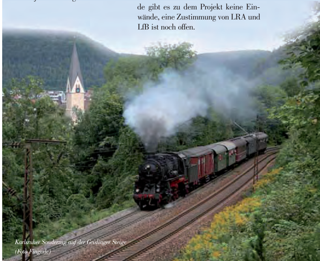
Karlsruher Sonderzug auf der Geislinger Steige

Um die Baukosten zu minimieren halten wir Ausschau nach einer geeigneten Gebrauchthalle mit der Grundfläche 10 x 60 m. Seitens der Gemeinde gibt es zu dem Projekt keine Einwände, eine Zustimmung von LRA und LfB ist noch offen.