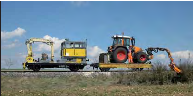
Heckenschnitt: 20 Kilometer links und 20 Kilometer rechts der Lokalbahn

schwerer See auf den Gleisen schaukelte. Da waren 20 km/h schon das allerhöchste der Gefühle und dies auf einer damals planmäßig betriebenen Strecke mit Schüler- und Güterverkehr.