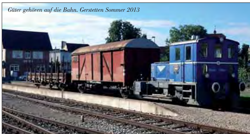
Güter gehören auf die Bahn. Gerstetten Sommer 2013

Bei den Einstellarbeiten am Schieber wurde dann ein Defekt an der Schwingenstange bemerkt!