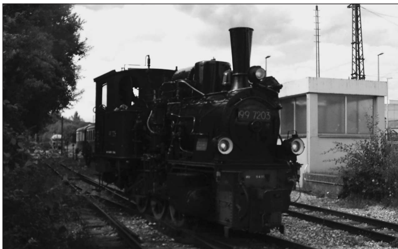
Lok 99 auf Jungfernfahrt

Genau im geplanten Zeitrahmen verlief die Kessel-HU unserer 99 7203, planmäßig konnten wir die Maschine am 19. August wieder offiziell in Betrieb nehmen. Die Kessel HU ist somit erfolgreich abgeschlossen. Der erste Betriebstag verlief ohne jegliche Probleme; mit Stolz kann die Arbeitsgruppe nun auf das gelungene Werk blicken. Der Weg bis zur notwendigen TÜV-Abnahme des Kessels verlief allerdings nicht ohne Hürden, doch auch dies hatten wir in unserem Zeitplan berücksichtigt. Denn unvorhersagbare Zusatzarbeiten sind bei solch einem Projekt zeitlich und finanziell mit einzukalkulieren. Der Einbau der 127 neuen Kesselrohre sowie das Anfertigen und die Montage der neuen Ein- und Ausströmrohre verliefen weitgehend planmäßig und ohne nennenswerte Schwierigkeiten.