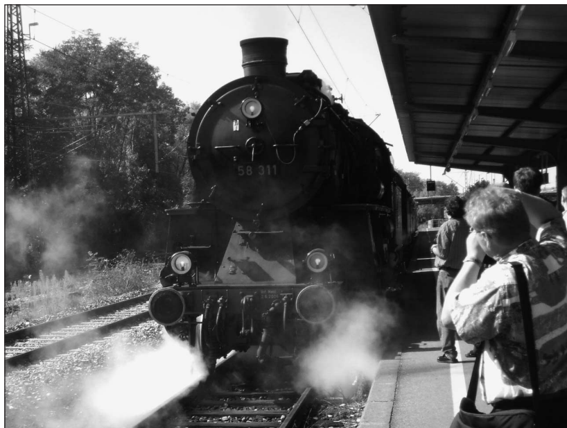
58311 in Göppingen

Mit den Freunden vom Historischen Dampfschnellzug ging es am bereits am 11.08. zu "Rhein in Flammen" nach Koblenz; den Zubringer nach Bruchsal sowie Anschubhilfe für das Hochrad 01 1066 besorgte 58 311;