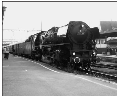
Ungewohnter Anblick: Wegen des Lichtraumprofils im Gotthardtunnel musste der Kaminaufsatz der 01 1066 entfernt werden. Hier im Bahnhof von Brunnen am Vierwaldstättersee

Und auch im Herbst und Winter ist noch etliches zu tun, ehe es an die Verlängerung der Kesselfrist gehen wird. Wie immer sind die aktuellen Fahrten auf der Homepage des HDS unter www.schnellzuglok.de nachzulesen und zu buchen.