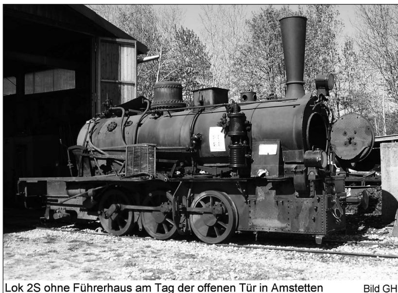
Lok 2S ohne Führerhaus am Tag der offenen Tür in Amstetten

Fast ein Jahr ist es inzwischen her, als Anfang November letzten Jahres zwei Übeltäter unser Vereinsheim verwüsteten (Abwasserrohre abreißen und die Wasserhähne aufdrehen) und ihr Pkw mit den vorhandenen Getränkekisten füllten. Die beiden Gefassten müssen voraussichtlich nun an die 7 Jahre absitzen (57 Delikte, unter anderem wegen versuchten Totschlages).