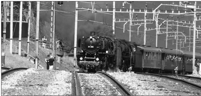
Fahrt über den Gotthard mit 01 202 und 01 1066